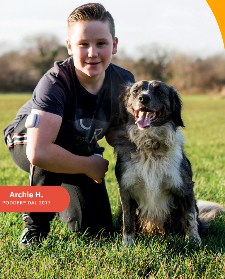
Archie H. PODDER™ DAL 2017

Sistema per la gestione insulinica Omnipod DASH®