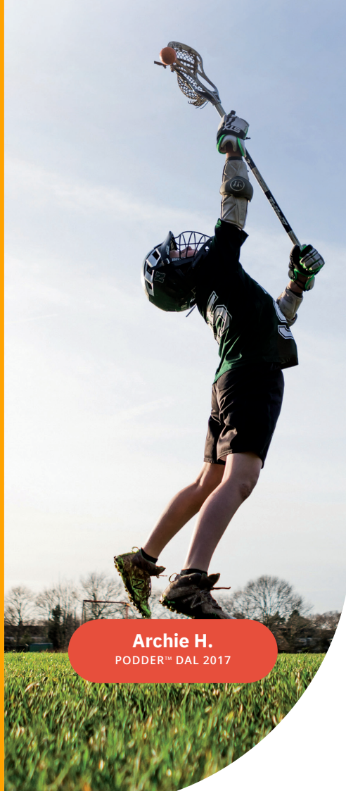
Archie H. PODDER™ DAL 2017